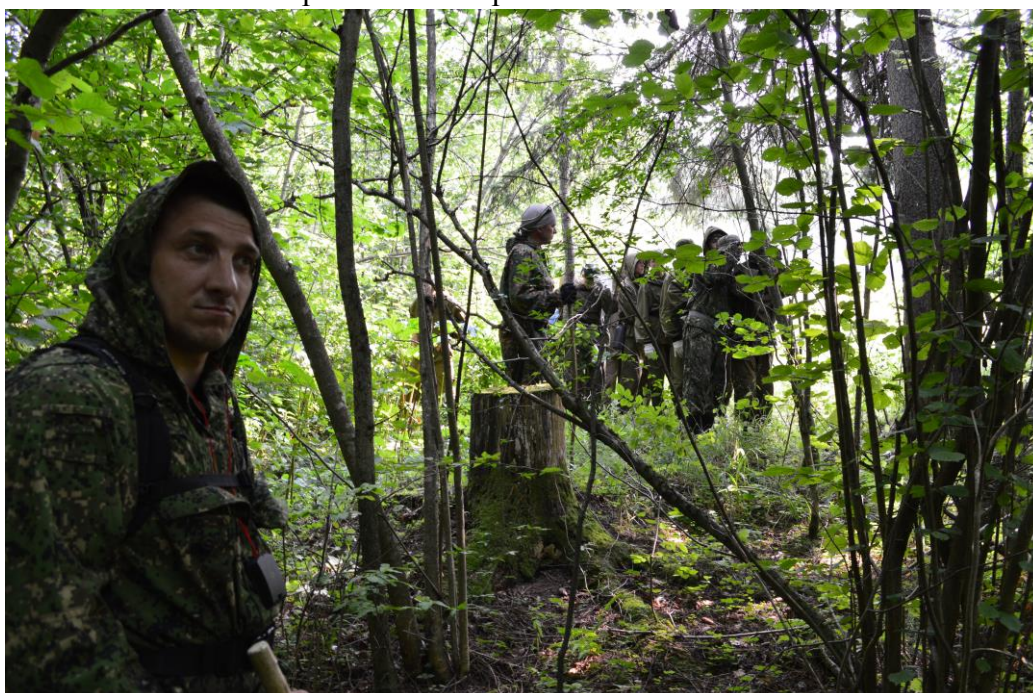
Отработка движения группы по заданному азимуту