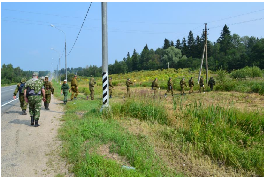
Выход группы обучаемых в лесной массив к месту занятий