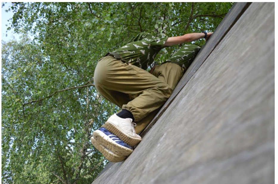
Элементы «Тропы разведчика» («Наклонная стенка»)