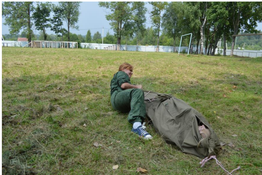
Формирование навыков переноски раненого