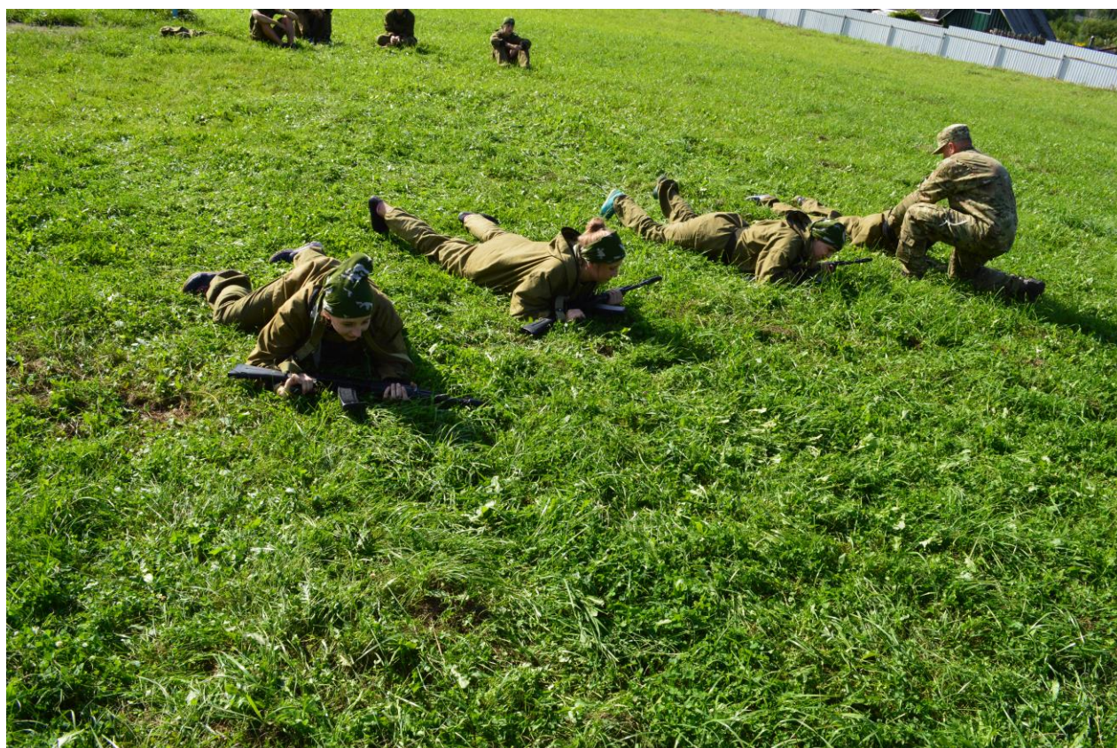
Элементы тактической подготовки (работа со страйкбольным оружием)