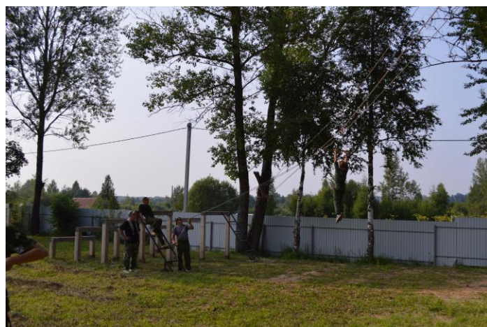
Прыжок на трапецию (высота площадки старта - 8 метров)