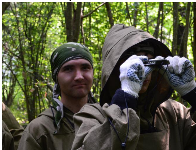
Практическая работа с компасом