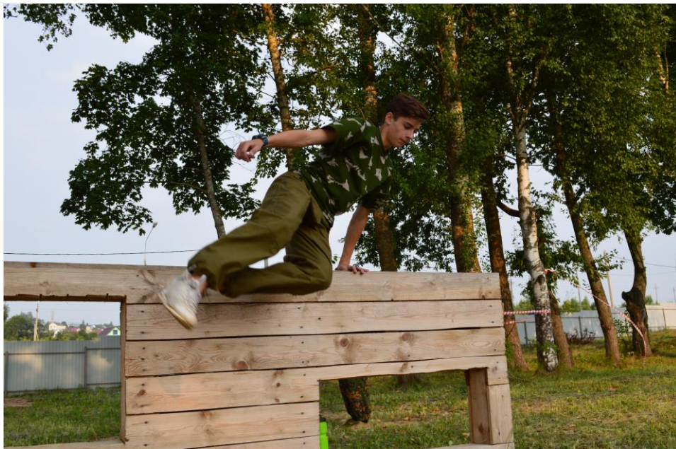
Элементы Общевоинской Полосы Препятствий