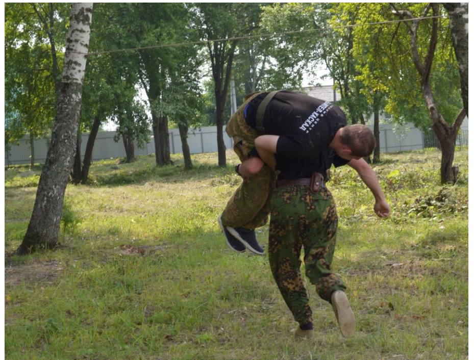
Формирование навыков переноски раненого