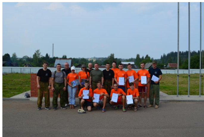
Закрытие семинара, награждение участников