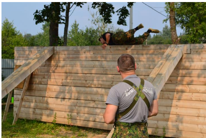
Элементы Общевоинской Полосы Препятствий