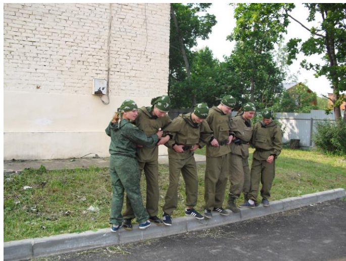
Упражнение «Проход по бревну»