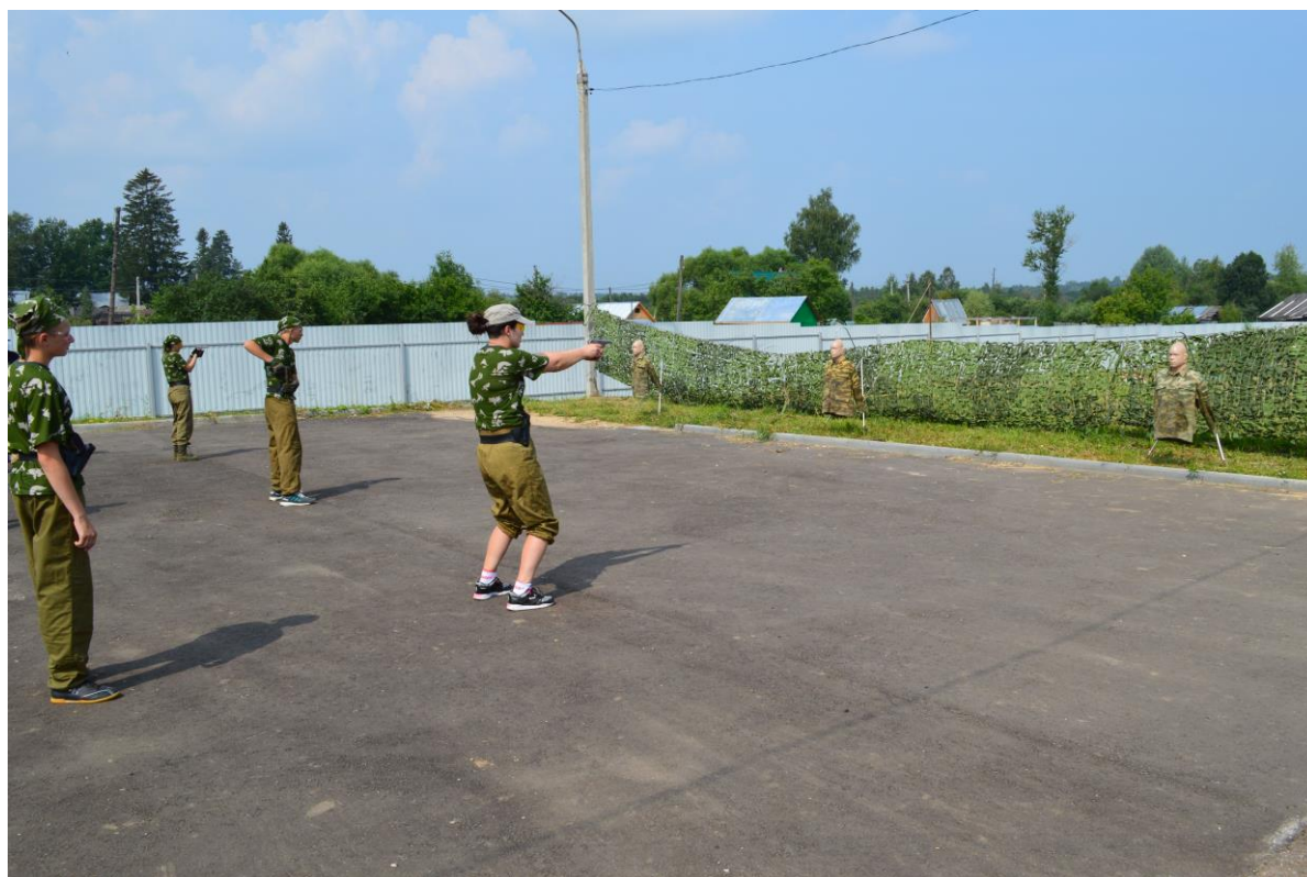
Элементы огневой подготовки (работа с пневматическим пистолетом МР-654К)