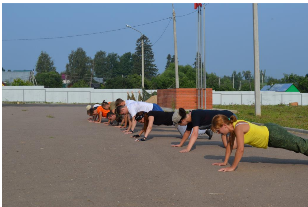
Элементы общей физической подготовки