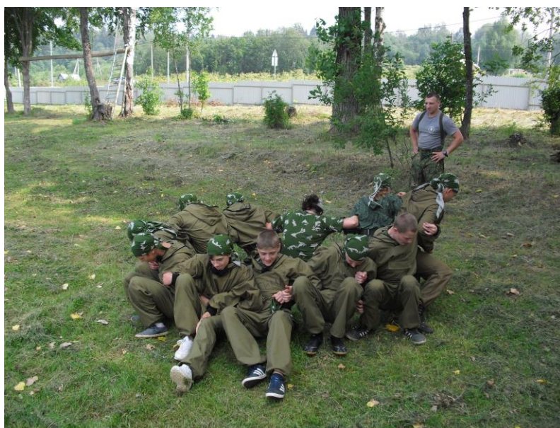
Упражнение «Вставание на счет»