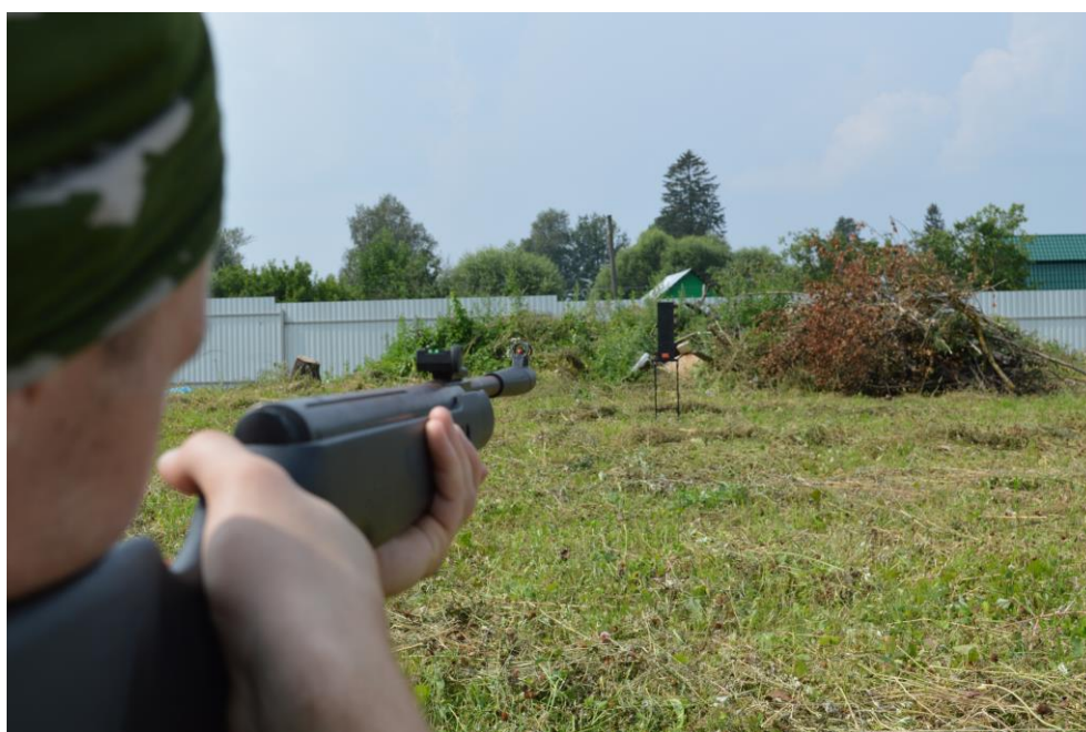
Элементы огневой подготовки (работа с пневматической винтовкой)